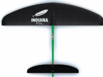
STANDARDNÍ délka trupu

Dobrá rovnováha mezi stabilitou a výkonem.